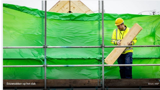
Bouwvakker op het dak

20-09-2021 07:00 | Politiek | Auteur: Petra Klapwijk