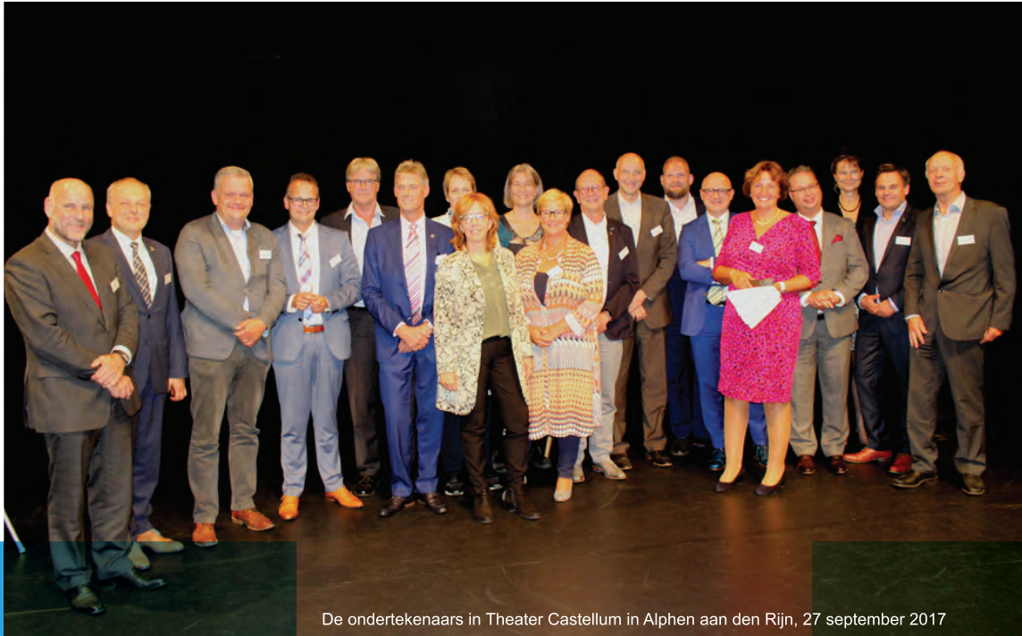
De ondertekenaars in Theater Castellum in Alphen aan den Rijn, 27 september 2017