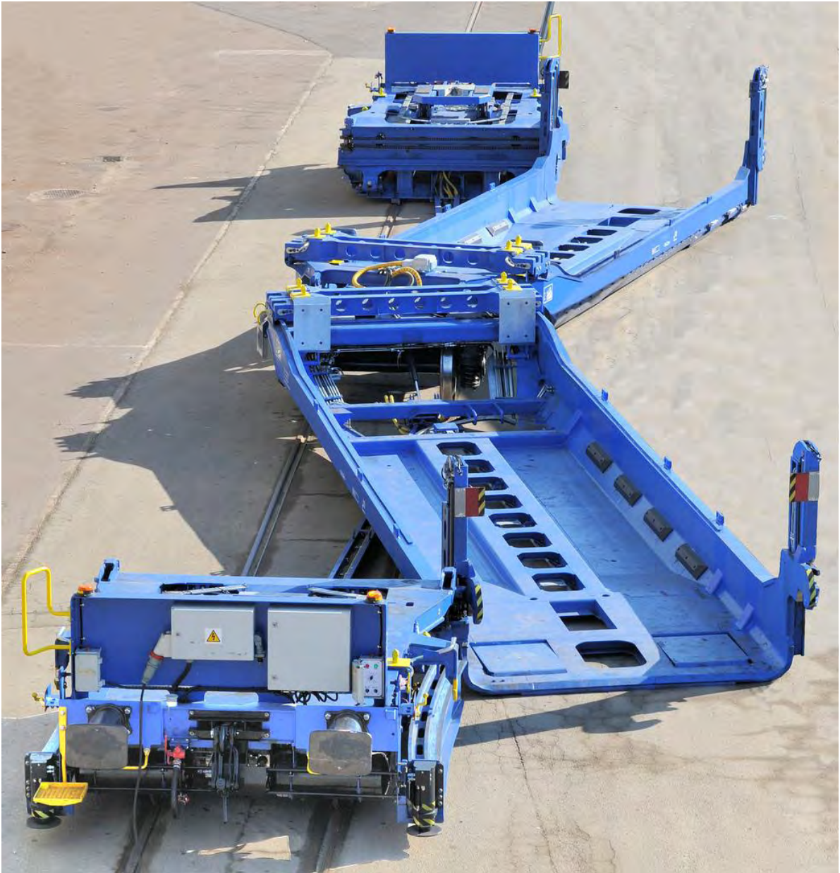
Foto: het Megaswing systeem.

Het verzoek aan Holland-Rijnland is om deze pilot te ondersteunen met een financiële bijdrage van € 100.000,--.