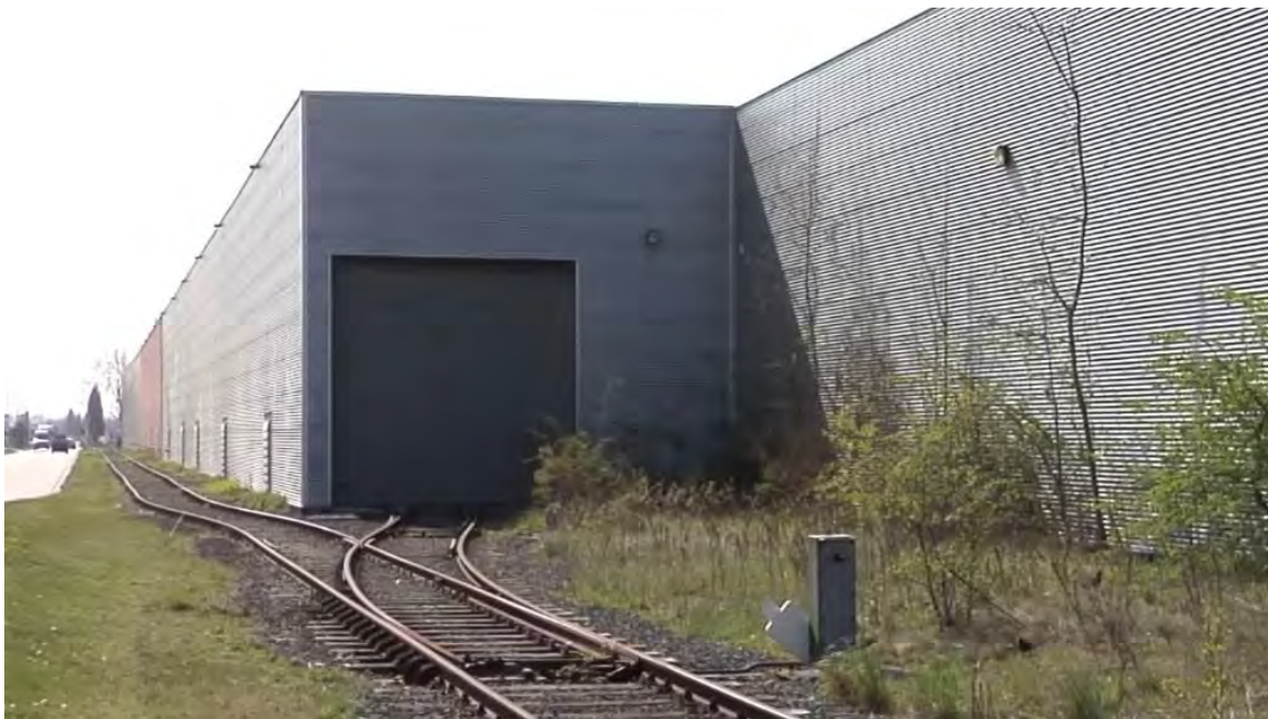
Foto: Stamspoor bij magazijnen Electrolux.

Om dit doel te verwezenlijken wordt beoogd een pilot te starten in samenwerking met Connekt, Electrolux, Nedcargo, Heineken, een aantal greenportbedrijven en andere bedrijven uit de regio om te verkennen of vervoer van goederen per spoor naar het Europese netwerk mogelijk is.