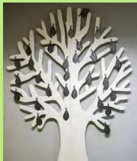
Gedenkboom overleden daklozen in Leiden - Folly Hemrica