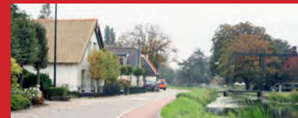
foto 1: lokaal

De instrumenten in de gele kolom geven aan welke ruimtelijke functies waar zijn toegestaan. Die in de blauwe kolom geven richting aan het ontwerp en inrichting van die functies. De kwaliteitskaart is in grote lijnen sturend voor de beeldkwaliteitsparagrafen. De gebiedsprofielen zijn een hulpmiddel bij de concrete vertaling van de kwaliteitskaart naar het maken van de beeldkwaliteitsparagrafen.