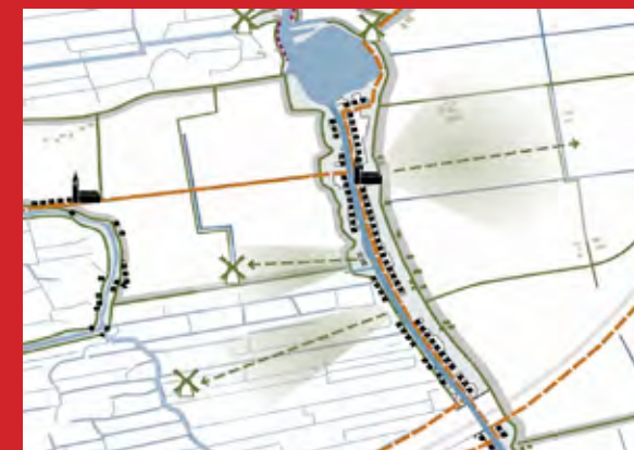
kaart 2: regionaal