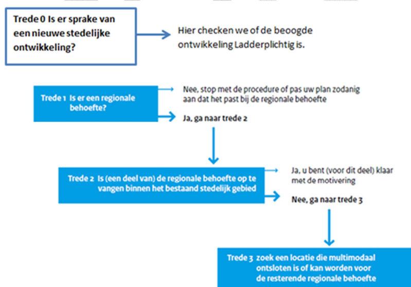
FIGUUR 1: SCHEMATISCH OVERZICHT LADDER VOOR DUURZAME VERSTEDELIJKING

De Ladder is van toepassing op een bestemmingsplan dat een nieuwe stedelijke ontwikkeling mogelijk maakt. Wij noemen dit trede 0. Pas als sprake is van een nieuwe stedelijke ontwikkeling moet een ontwikkeling worden gemotiveerd volgens de treden van de Ladder.